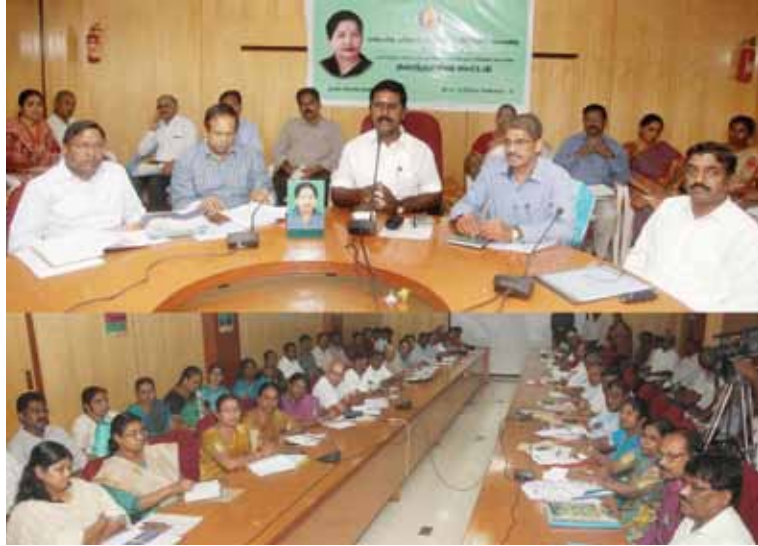
மாண்புமிகு உணவுப்பொருள் வழங்கல் மற்றும் நுகர்வோர் பாதுகாப்புத்துறையின் அமைச்சர் திரு.இரா.காமராஜ் அவர்கள் முன்னிலையில் நடைபெற்ற பொது விநியோகத்திட்ட கலந்தாய்வுக் கூட்டம்