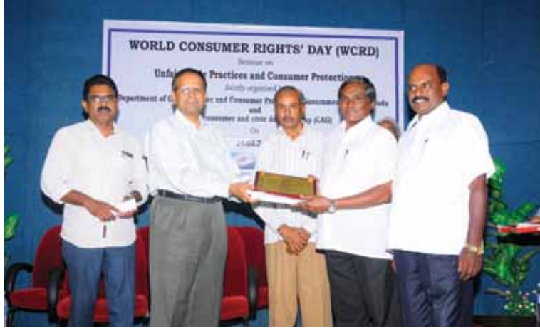
உலக நுகர்வோர் உரிமை தின விழாவின் போது எடுத்த புகைப்படம். அப்பொழுது தேனி மாவட்ட நுகர்வோருக்கு விருது வழங்கப்பட்டது.