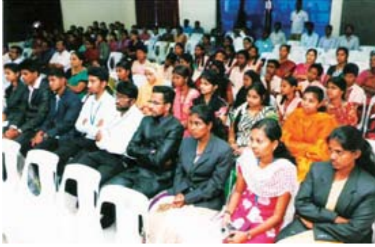
கோயம்புத்தூர் உணவுப்பொருள் வழங்கல் மற்றும் நுகர்வோர் பாதுகாப்புத் துறையின் சார்பில் நடைப்பெற்ற விழாவில் கலந்து கொண்ட மாணவ மாணவியர்கள்