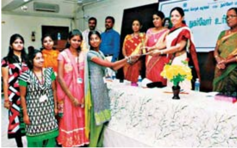
கோயம்புத்தூர் உணவுப்பொருள் வழங்கல் மற்றும் நுகர்வோர் பாதுகாப்புத் துறையின் சார்பில் நடைப்பெற்ற விழா